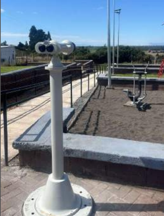
Mirador Los Volcanes, La Unión Región de Los Ríos