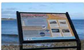
Panel de Interpretación HDC EcoGraphic CHPL en Lossiemouth, Escocia