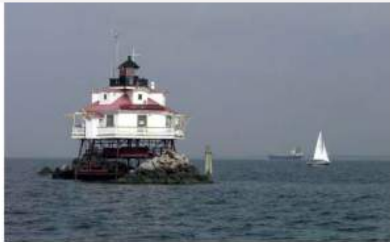
Consultores en Interpretación de Faros