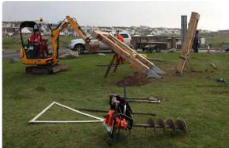
Instalación de Exhibiciones