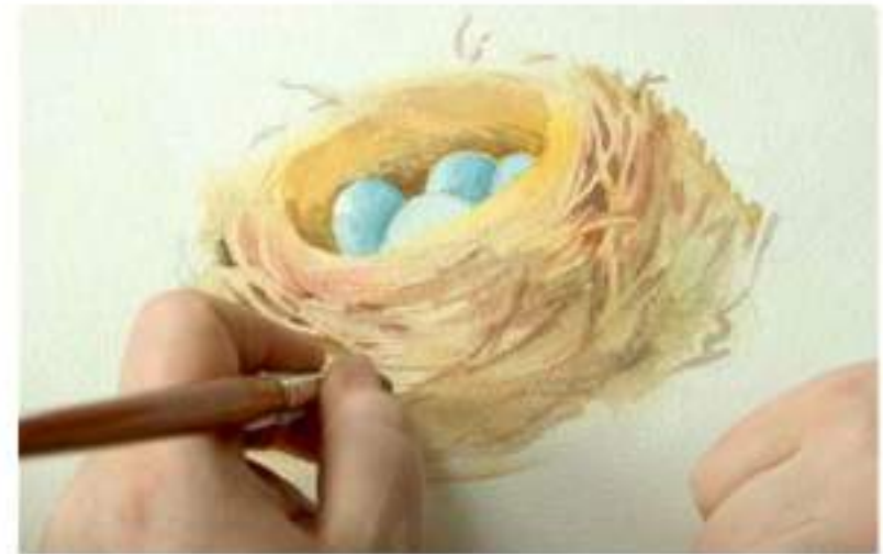
Ilustración y Arte