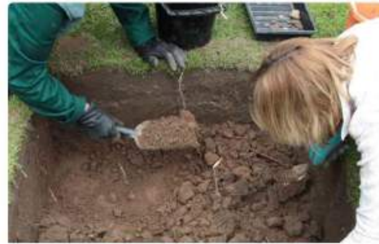
Interpretación en Sitios Arqueológicos