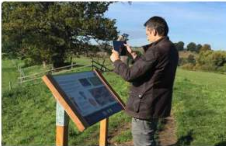
Apps para Interpretación