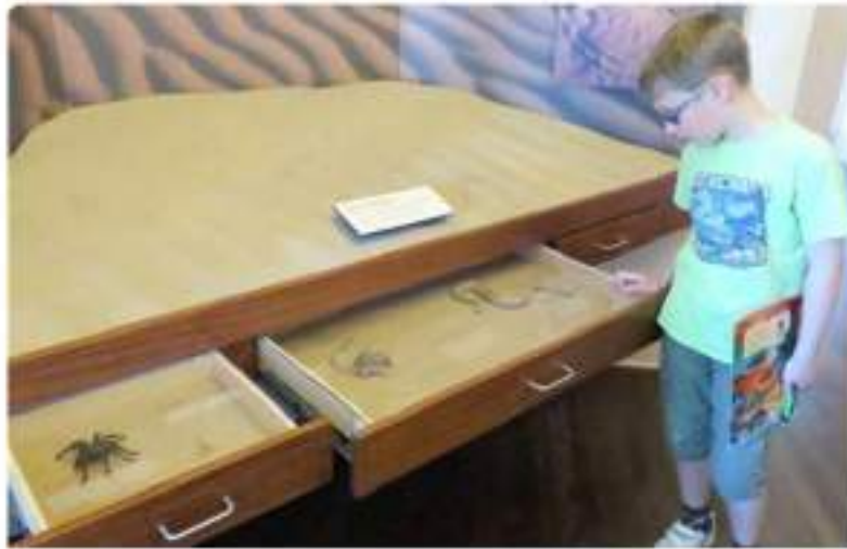
Evaluación de Exhibiciones Interpretativas