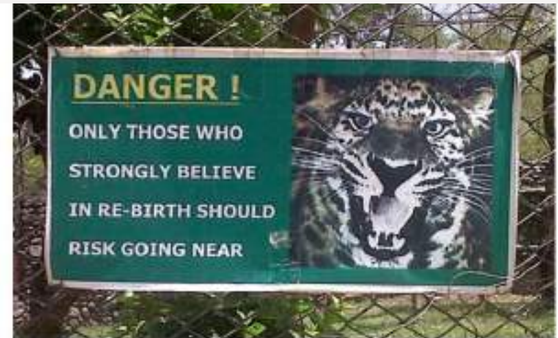
Interpretación en Zoológicos, Acuarios y Parques de Vida Salvaje