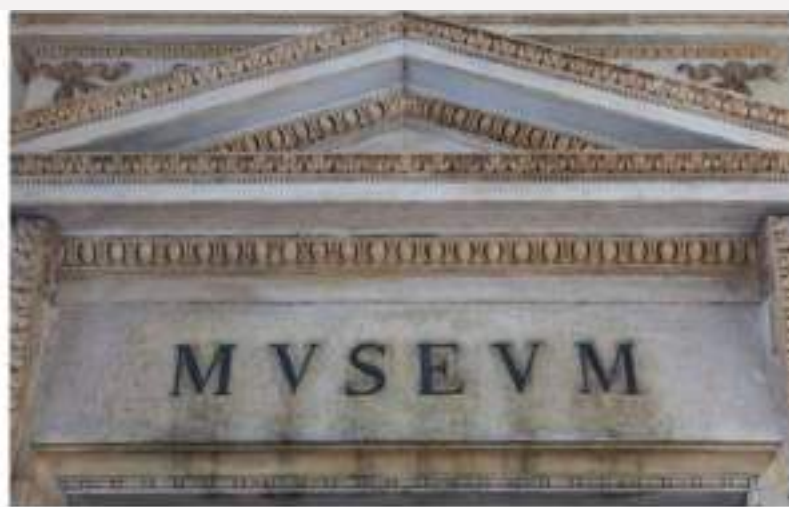
Consultores en Interpretación de Museos