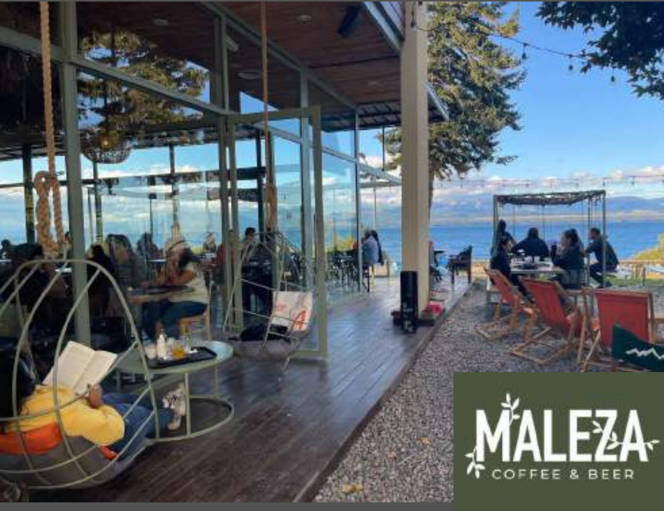
Restaurant Maleza, Bariloche, Argentina