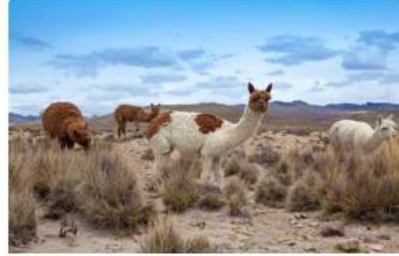
Interpretación de Patrimonio en Parques Nacionales