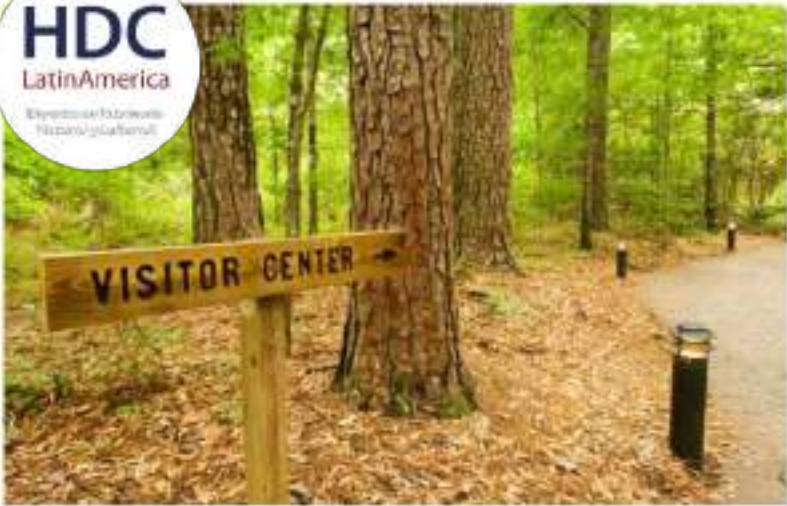
Planes Maestros de Interpretación