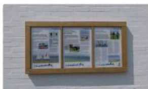
Panel de Interpretación HDC EcoGraphic CHPL en Chichester Harbour, Reino Unido

HDC LatinAmerica ¡Expertos en Patrimonio Natural y Cultural!