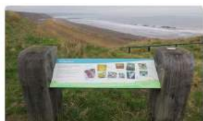
Panel de Interpretación HDC EcoGraphic CHPL en Blackhall Rocks Nature Reserve in Co Durham, Reino Unido