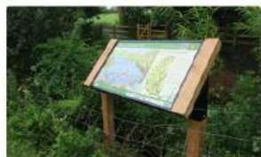
Paneles, Tableros y Señales de Interpretación HDC EcoGraphic CHPL HDC EcoGraphic CHPL, Paneles Interpretativos montados sobre HDC NPS Oak Lectern en Derbyshire Wildlife Trust, Reino Unido.