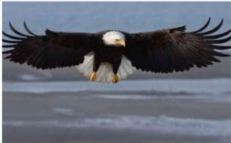
Consultores Turísticos en Observación de Aves