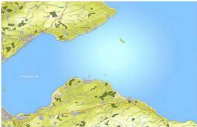
Diseño de Mapas