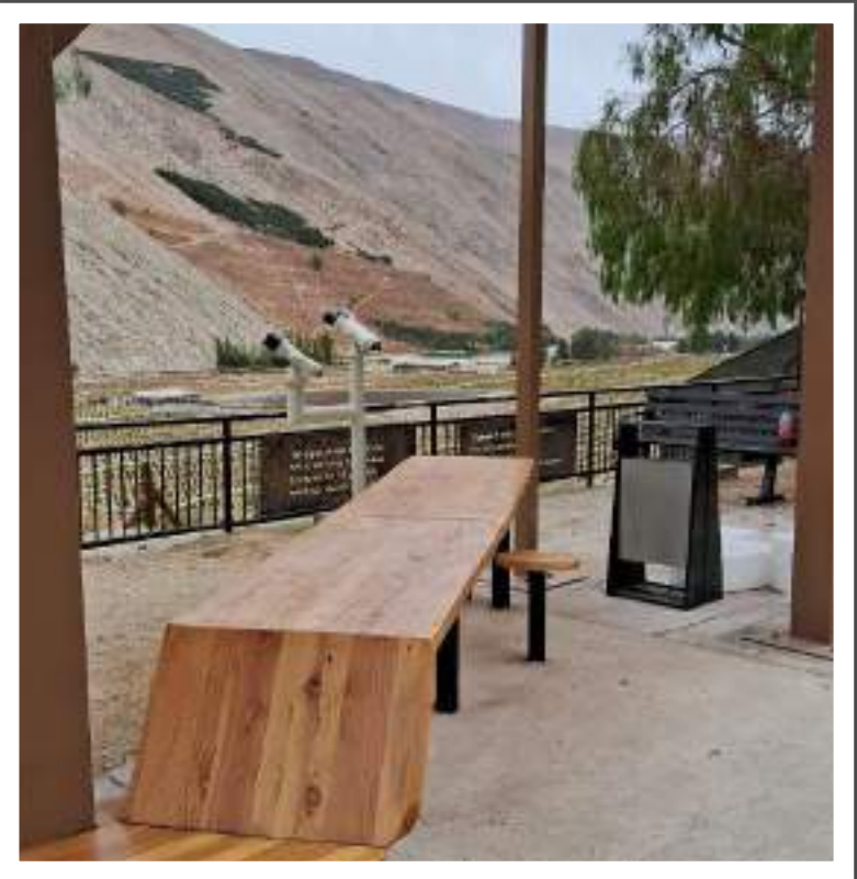
Mirador Chañar Blanco Paihuano Región de Coquimbo