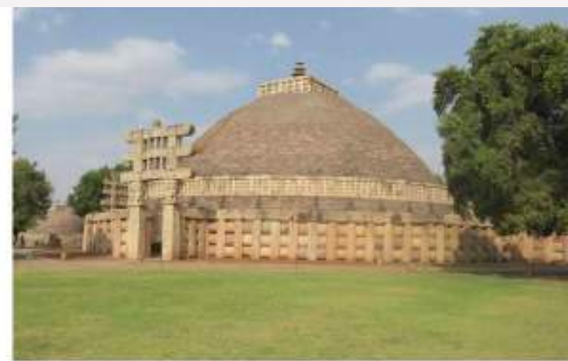
Interpretación en Sitios Sagrados y Religiosos