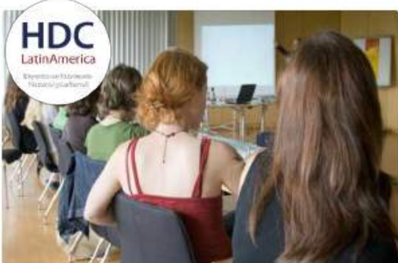
Entrenamiento para Interpretación de Patrimonio