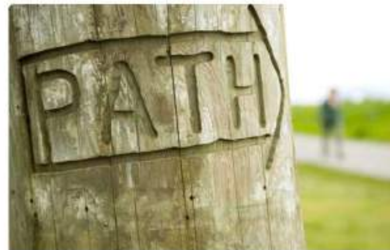
Consultores para Senderos Interpretativos Patrimoniales