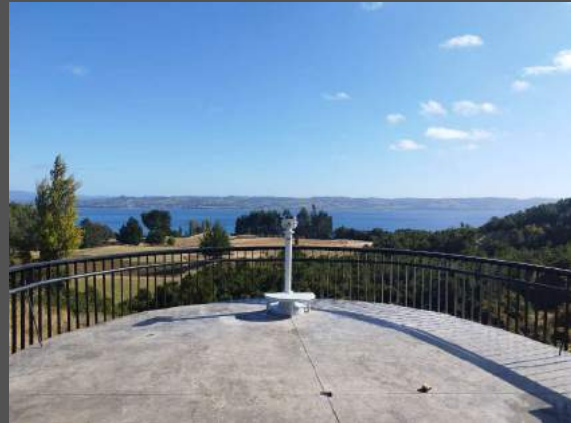
Mirador Vista Hermosa, Puqueldón Chiloé, Región de Los Lagos