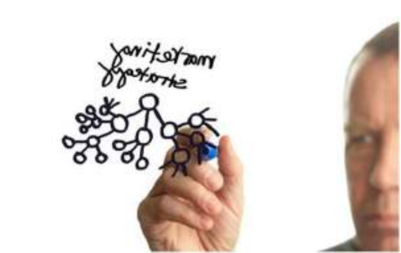
Consultores en Estrategia Turística y Desarrollo de Políticas Públicas