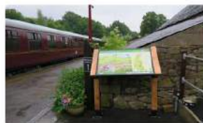
Paneles Interpretativos HDC EcoGraphic CHPL Paneles Interpretativos HDC EcoGraphic CHPL montados sobre HDC NPS Oak Lectern en Ecclesbourne Way, Reino Unido.