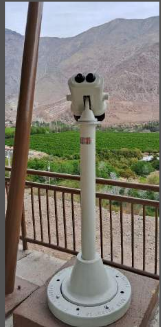
Mirador de Ovnis, Sector La Conchina, Comuna de Paihuano, Región de Coquimbo, Chile