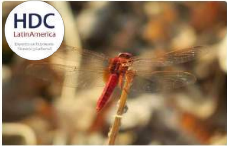
Consultores en Interpretación de Vida Salvaje