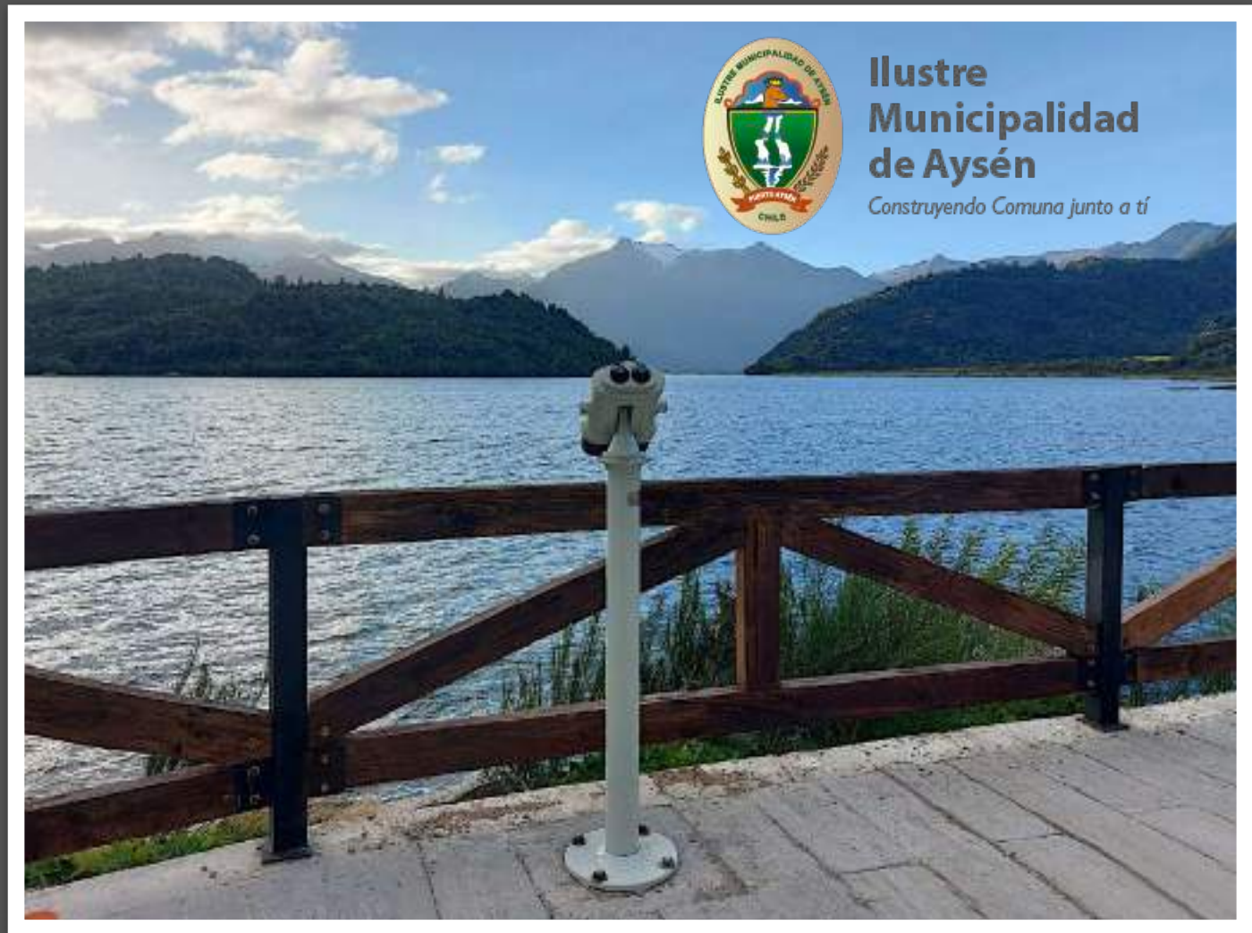
Mirador Nevado Acantilado, Puerto Chacabuco Comuna de Puerto Aysén Región de Aysén, Chile