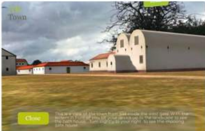
Realidad Aumentada para Interpretación