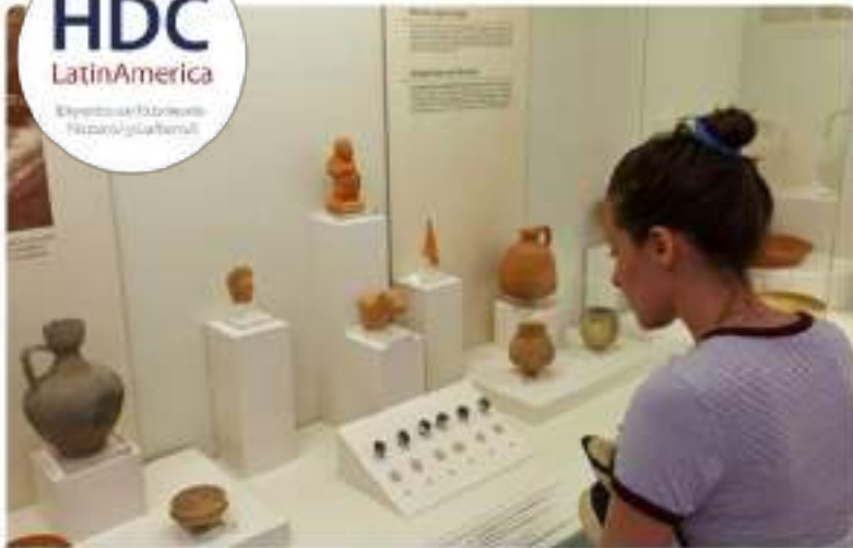
Diseño de Exhibiciones

Directorio de Museos Nacionales y Locales