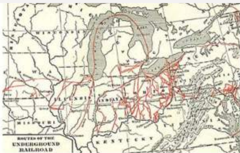
Interpretación de Cementerios