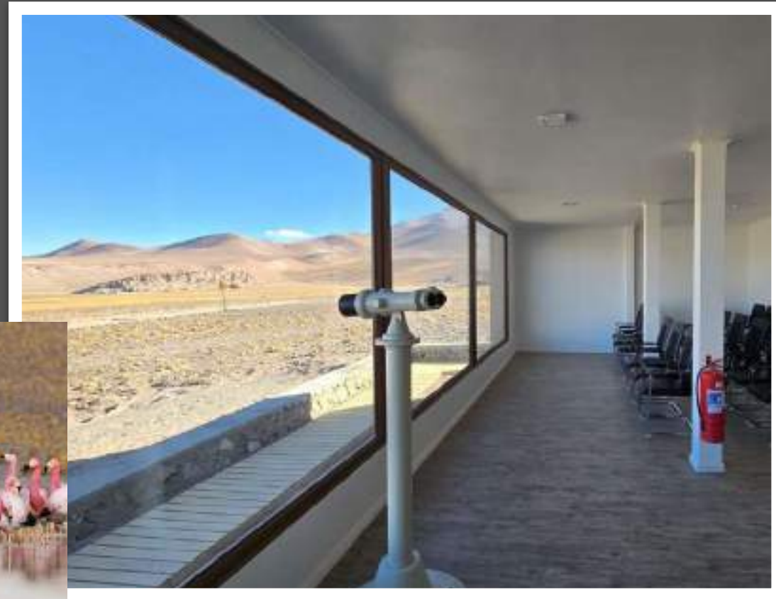
Parque Nacional Nevado Tres Cruces, Copiapó, Región de Atacama, Chile