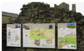
Paneles, Tableros y Señales de Interpretación HDC EcoGraphic CHPL Paneles de Interpretación HDC EcoGraphic CHPL montados en la pared en Maggie Mine en Derbyshire, Reino Unido.