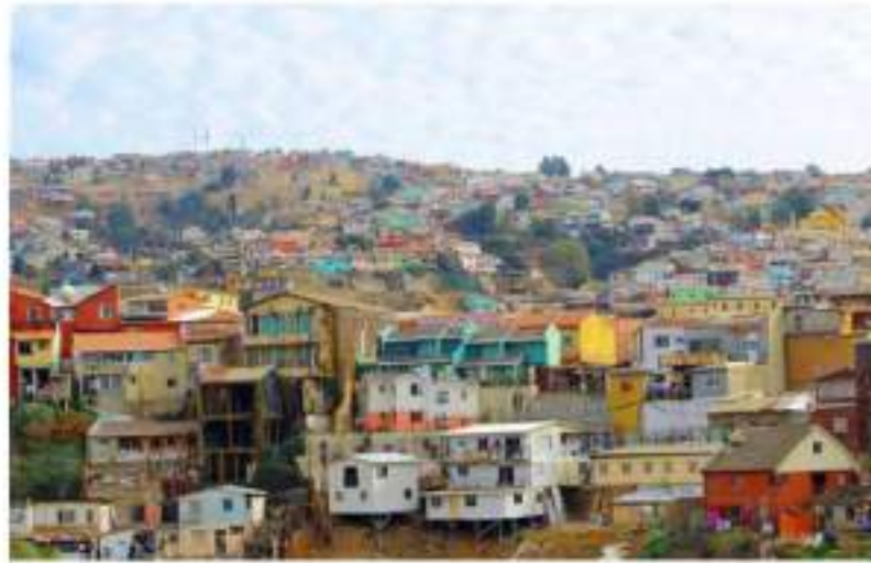
Consultores en Pueblos y Ciudades Históricas