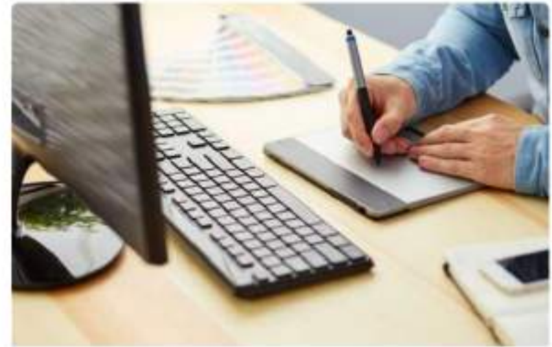
Diseño Gráfico Interpretativo